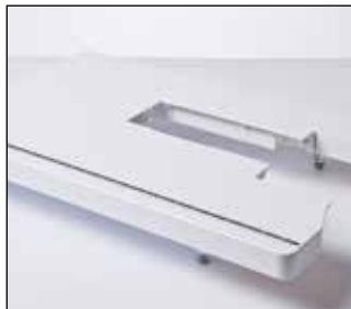
Table d'extension extra-large

Idéal pour les ouvrages de quilting. Ce cadre robuste permet à votre tissu de rester tendu et convient aux tissus lourds. Parfait pour les débutants et les passionnés.